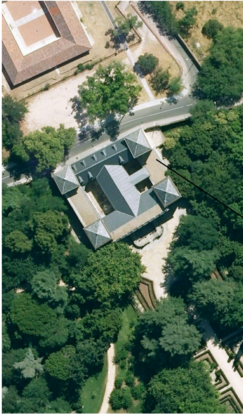
VISTA AÉREA DEL PALACIO DEL CAPRICHIO