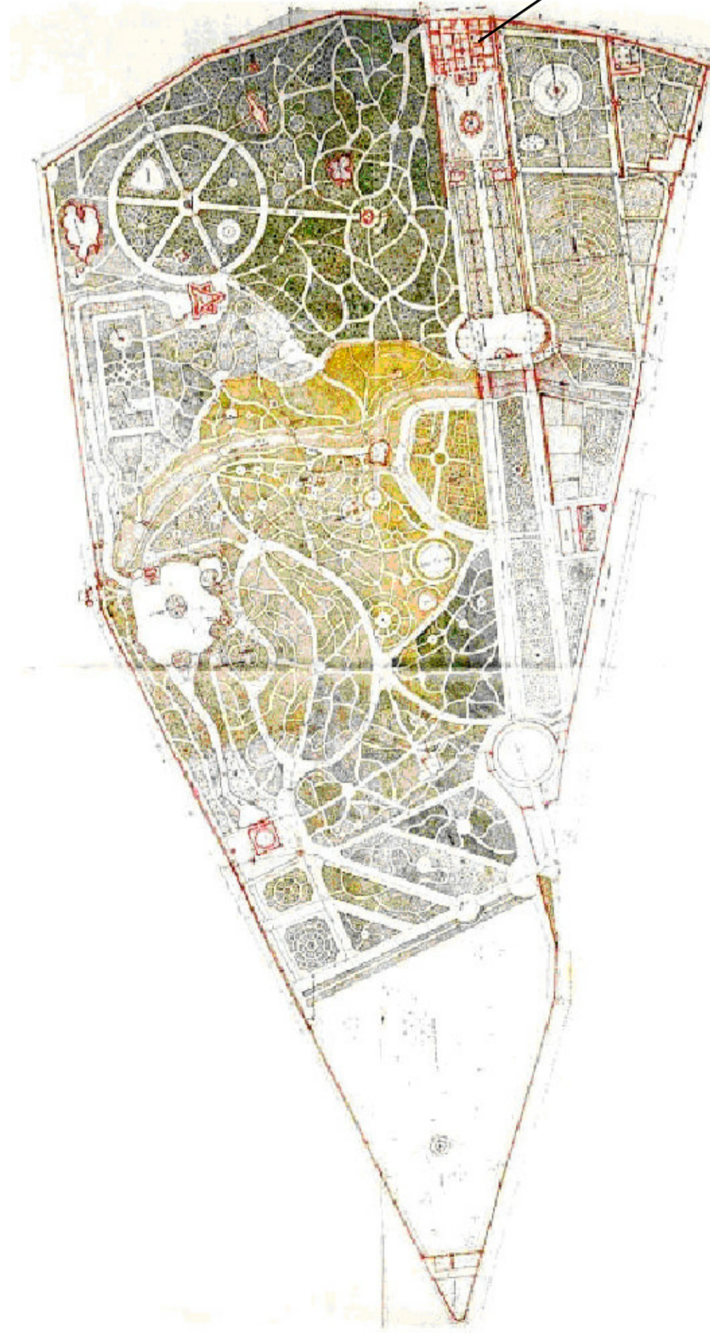
HIPÓLITO LAUR, PLANO GENERAL DEL CAPRICHIO, PUBLICADO POR EL INSTITUTO GEOGRÁFICO Y CATASTRAL EN 1870