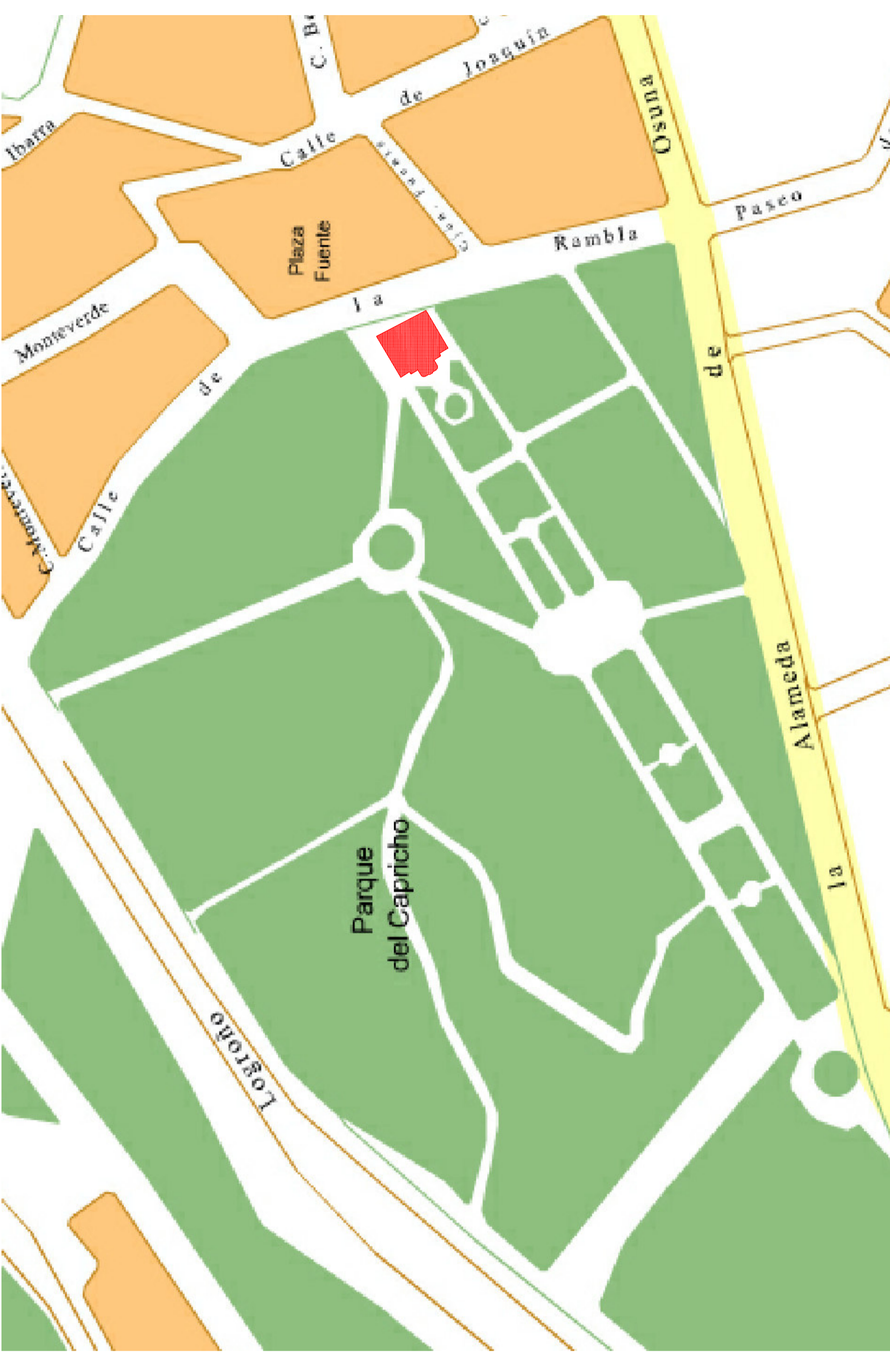
SITUACIÓN e.: 1/2.500